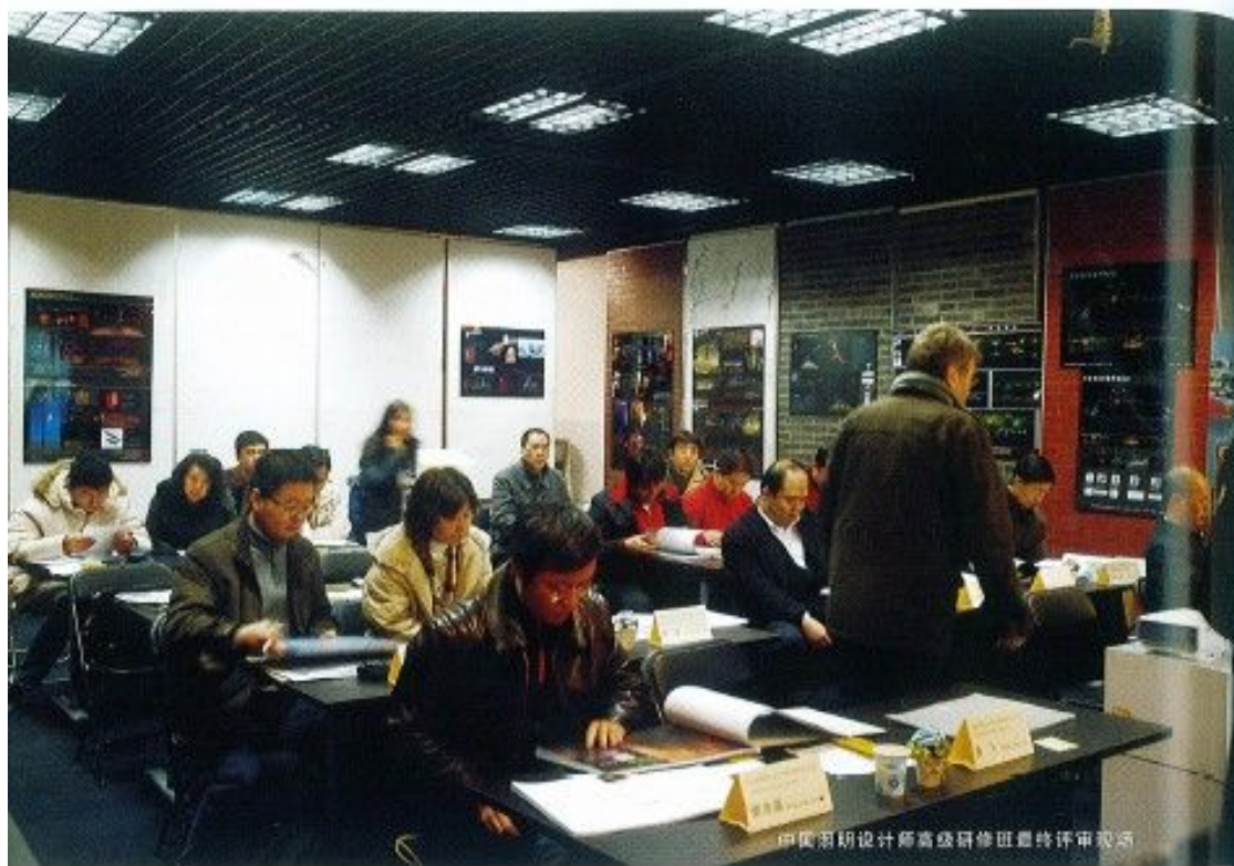
中国照明设计师高级研修班最终评审现场

照明工程公司以及厂商等的沟通和交流，这对于照明行业来说是非常有意义的。随后，会议正式开始对学生的照明项目进行评审。