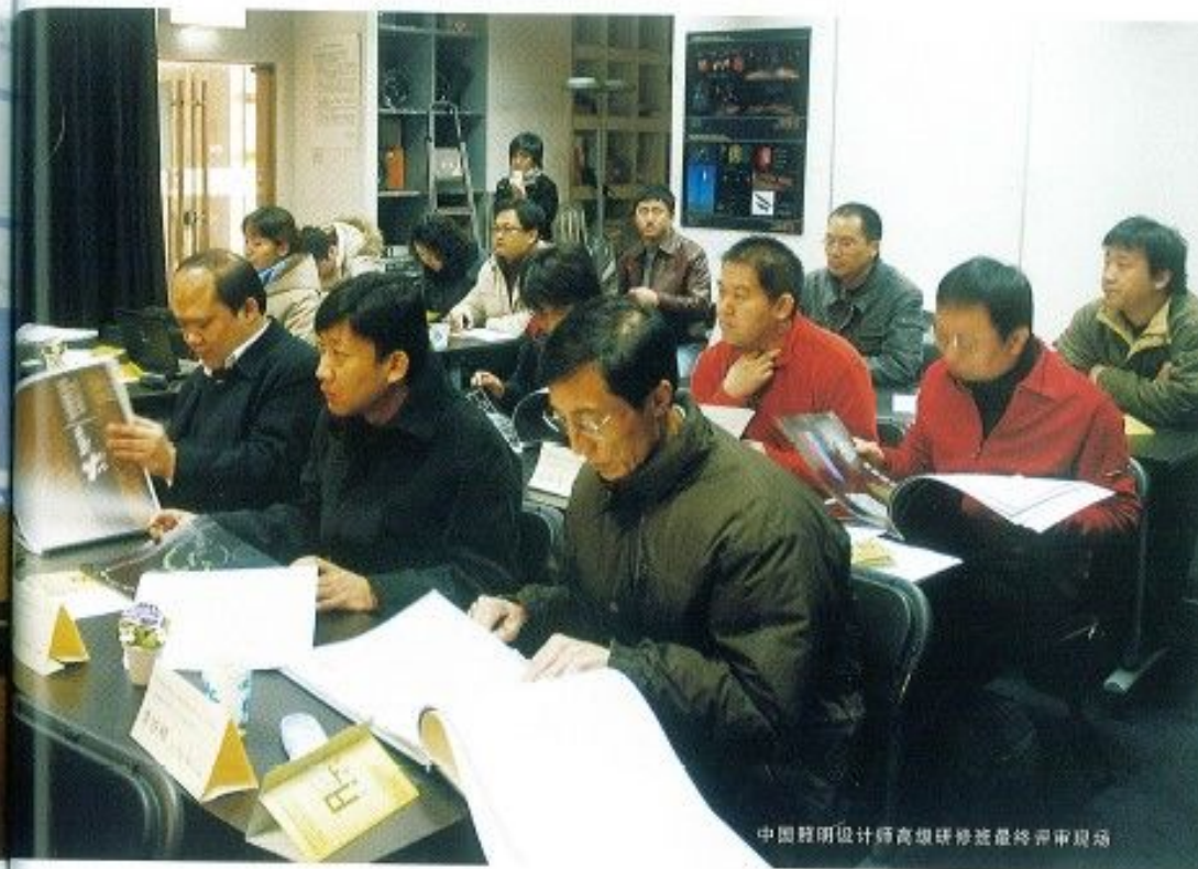
中国照明设计师高级研修班最终评审现场