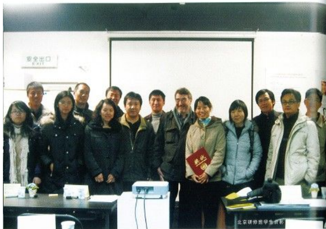
北京研修班学生合影