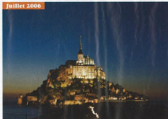
Juillet 2006 Depuis le 10 juillet, c'est désormais l'ensemble du village touristique le plus visité d'Europe qui s'illumine par touches successives.

pilote les chantiers. Celui-ci a nécessité 21 kilomètres de câbles, 1 476 appareils d'éclairage et quelque 8 206 heures de travail jour et nuit. « Comme au cinéma, il a fallu "être raccord" avec la première phase de l'éclairage et veiller à ne