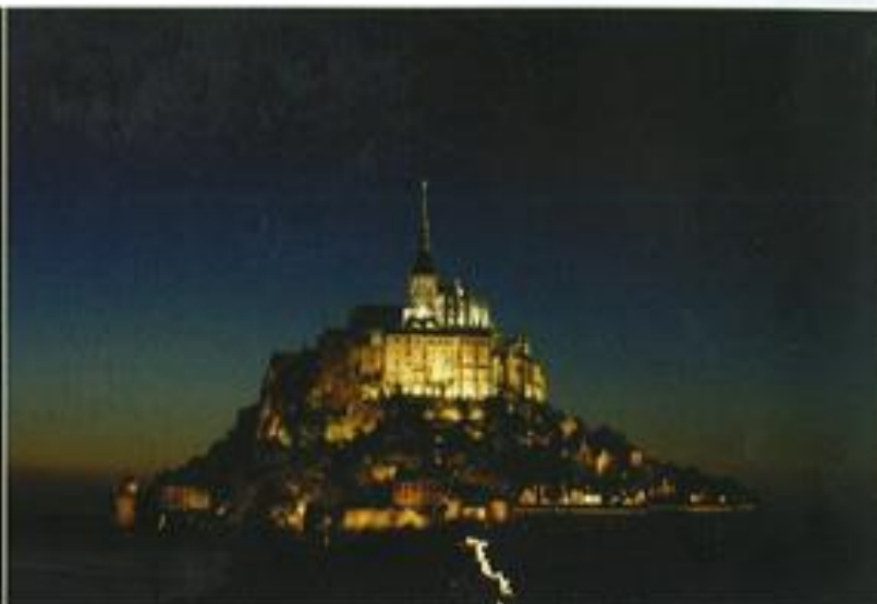
Le Mont Saint-Michel vu de la digue (face sud). La réalisation finale s'approche au plus près du dessin de Louis Clair.